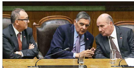
Los ministros José García (Segpres) y Claudio Alvarado (Interior) apoyaron al titular de Hacienda, Jorge Quiroz, en la discusión del plan de ayudas en el Congreso.

Como parte del trabajo prelegislativo del plan de reconstrucción, los ministros de Interior, Segpres y Hacienda ya se reunieron con los presidentes de los partidos oficialistas.