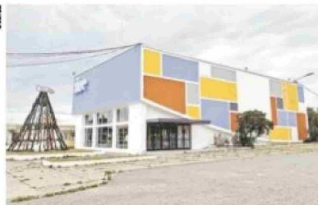
ProCultura realizó la restauración del Cinema Porvenir y del cine de Cerro Sombrero.