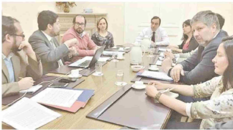
La primera imagen de Larraín en Punta Arenas.