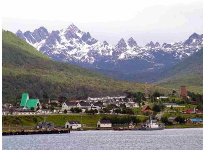
Puerto Williams es la ciudad más austral del mundo, con una fuerte proyección antártica.

El aislamiento no es una fatalidad en Magallanes, es un problema de diseño. Una región que tiene mar en casi todos sus costados no debería sentir que el mundo le da la espalda, pero durante décadas esa ha sido la experiencia de sus habitantes. Las rutas aéreas con conexiones escasas, las carreteras que se cortan por la frontera binacional y con las lluvias o la nieve, los precios inflados por el costo del flete: todo eso configura una cotidianeidad marcada por la distancia. El mar, paradójicamente, es la solución que más cerca ha estado siempre y que menos se ha aprovecha-