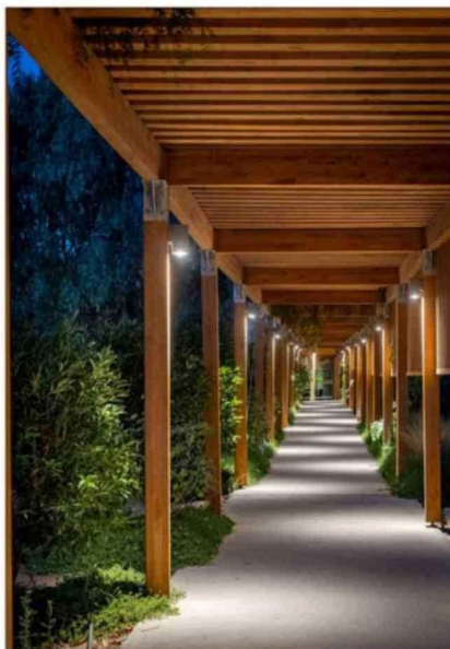
Uno de los énfasis de la remodelación fue entregar mayor calidez al lugar, por eso se agregaron corredores de madera.

minaciones. Cuando se arman tienen una forma parecida a un container, pero no lo son", dice.