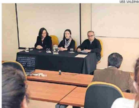
LA CHARLA QUE MARCÓ EL INICIO DE LA FUNDACIÓN EN 2022.

Con ello se están instaurando nuevas instancias para que las nuevas generaciones conoz-