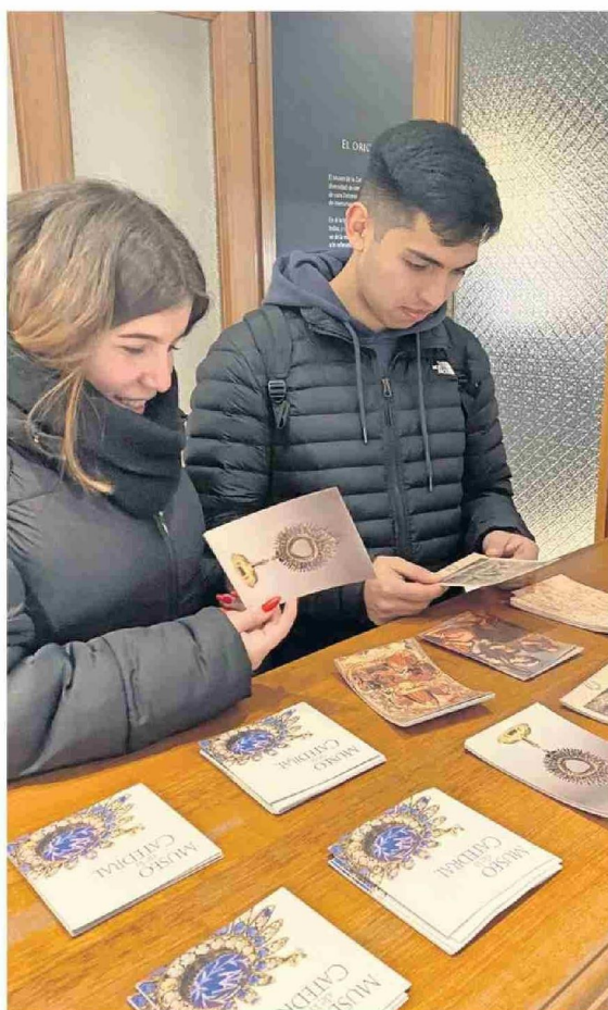
EL HITO MÁS RECIENTE DE LA FUNDACIÓN FUE HABER PARTICIPADO, CON EL MUSEO DE LA CATEDRAL, EN EL DÍA DE LOS PATRIMONIOS EN VERANO.

La Catedral de Valdivia hizo eco de aquello y habilitó parte de sus dependencias para tener su propio museo con exhibición de imaginaria religiosa e historia contemporánea de la iglesia. Está en el zócalo del edificio con ingreso por calle Independencia N° 514.