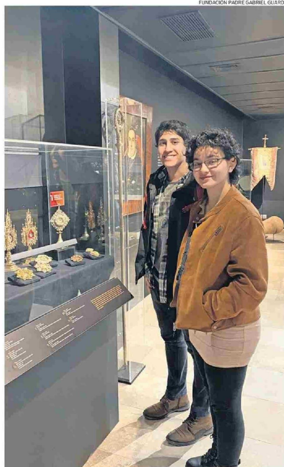
FUNDACIÓN PADRE GABRIEL GUARDA