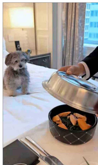
Hace poco más de un mes, el hotel Waldorf Astoria de Nueva York lanzó el programa BarkAvenue que incluye diferentes atenciones de lujo para mascotas.

En Chile, varios hoteles se han unido a esta tendencia, que busca reforzar experiencias exclusivas y