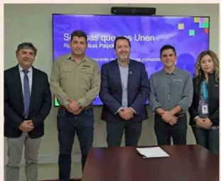
La firma del convenio se realizó en las oficinas de Kinross.

Si bien esta iniciativa no resuelve por completo el déficit estructural en salud bucal, sí representa un avance concreto en territorios donde las soluciones suelen tardar en llegar. En medio de una problemática país, acciones como esta evidencian el rol que pueden jugar las alianzas público-privadas para acercar la salud a quienes más lo necesitan.