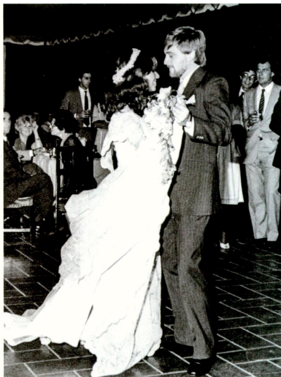
Con poco más de un año de pololeo, Alejandra de 21 años y Hernán 25, contrajeron matrimonio el 20 de enero de 1984.

En su libro La vida golpea (a veces) demasiado fuerte el presidente del Colegio de Ingenieros, Hernán de Solminihac Tampier, abandonó la coraza que lo mostraba como un hombre racional, práctico y poco amigo de las emociones. Al menos, de las emociones públicas.