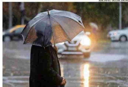
412 MIL CLIENTES SE QUEDARON SIN LUZ.