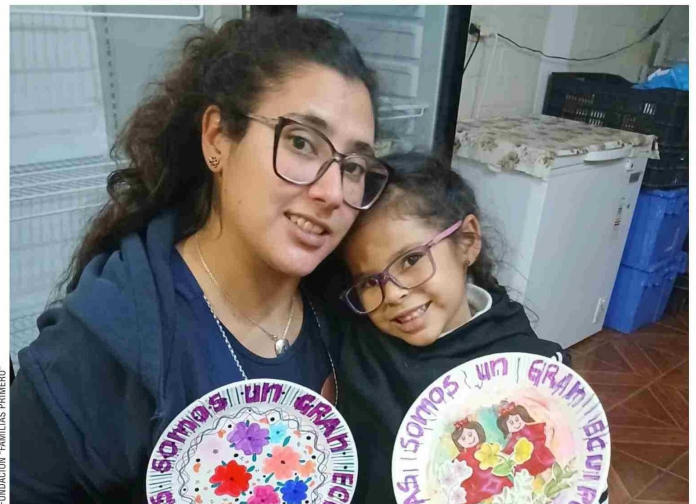
FUNDACIÓN FAMILIAS PRIMERO

Lejos de lo ornamental, cada plato representó una historia: la importancia de conversar durante el almuerzo, la once o la cena, de escucharse y conectar en medio de la vida cotidiana. “Interactuar en la mesa puede parecer algo cotidiano, pero cuando ese espacio se vuelve intencionado y