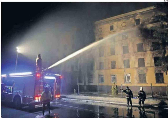
BOMBEROS UCRANIANOS EXTINGUEN UN FUEGO EN UN EDIFICIO ATACADO POR RUSIA.

sorprendió a todos al inicio de la noche del jueves cuando el presidente ruso había aceptado su posición. Hace un frío recordamos muy contentos aparte de todo, lo último que le necesitaban (los ucranianos) que les caigan misiles a las ciudades", ejemplo. El presidente ruso confirmó ayer que se abstendrá de realizar ataques con el fin de crear condiciones favorables para la negociación de negociaciones. "Si Rusia no ataca nuestro sistema energético, ya sea a la capacidad de generación o a cualquier otro elemento, nosotros no atacaremos su sistema energético", dijo Zelenski. Millones de ucranianos han sufrido desde finales del pasado año constantes cortes de luz y calefacción de varios días debido a los ataques masivos rusos contra el sistema energético del país. Ucrania vive el invierno más crudo de los últimos lustros.