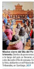
Masivo cierre del Día del Patrimonio. Cientos de panoramas a lo largo del país se llevaron a cabo durante el fin de semana. En la foto, visitantes en el Palacio de Tribunales, en Santiago. | 7

Elecciones en Colombia: Gustavo Petro desconoce resultados que dan primera mayoría a la derecha Abelardo de la Espriella (Defensores de la Patria) alcanzaba anoche el 43,7% en el preconteo oficial, superando a Iván Cepeda (40,9%), de Pacto Histórico, movimiento de izquierda al que también pertenece el mandatario, quien desacreditó los datos arrojados por el sistema informático. El balotaje será el 21 de junio. | 4