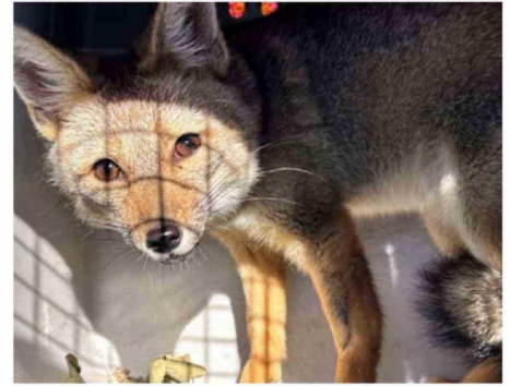
LA ZORRA CHILLA FUE LIBERADA EN SU HÁBITAT NATURAL.