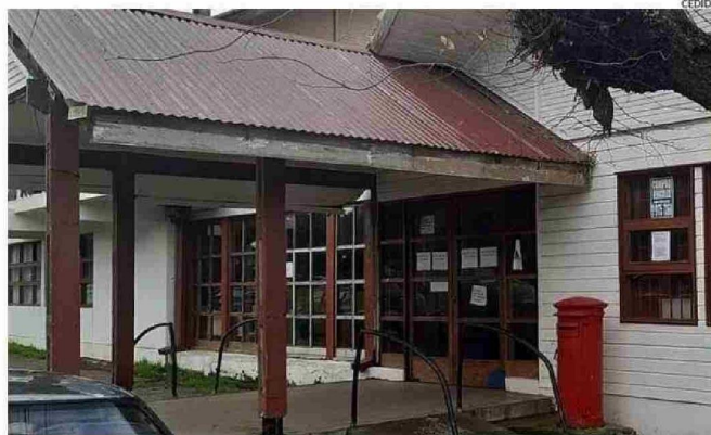
LA ACTUAL ADMINISTRACIÓN PLANEA DEFINIR LINEAMIENTOS QUE LLEVEN A DISMINUIR LAS DEUDAS POR AGUA.

de Puerto Octay se califica como rural, por lo que mantiene sus propios sistemas y la planta abastece sólo a quienes viven en el sector urbano.