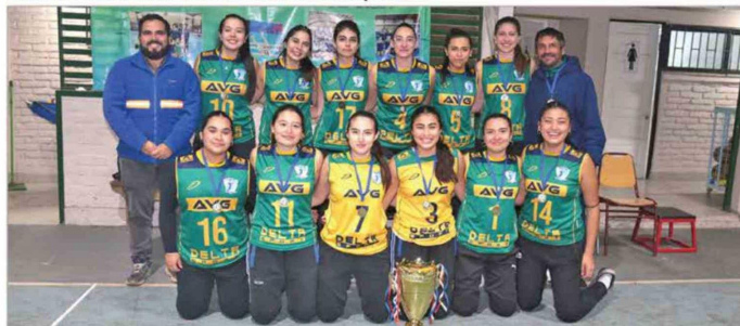
Fondos Concursables MVC - Premiación Campeonato de Voleibol Requínoa.

de yoga para adultos mayores, proyectos de medicina alternativa comunitaria para jefas de Hogar o implementar Talleres de Compostaje en colegios, entre muchos otros, los programas de liderazgo local, envejecimiento activo, vida saludable y formación de competencias que seguiremos impulsando este año nacen desde la co-construcción y el desarrollo comunitario. Otro compromiso dentro de nuestro plan de relacionamiento es con las empresas colaboradoras (EECC.) de MVC, fundamentales en el día a día de nuestra operación. Porque si a ellas les va bien, a nosotros también. Por eso privilegiamos perma-