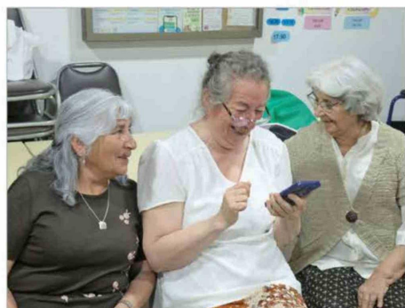
Taller de Alfabetización Digital en Cediám Olivar-Gultro.

Uno de los ejes del modelo de economía circular de Minera Valle Central (MVC) es nuestro plan de relacionamiento comunitario, cuyo objetivo es ser un "buen vecino" de las comunidades de Requínoa y Olivar, cercanas a nuestra operación, a través de un trabajo colaborativo cuyo fin es mejorar la calidad de vida de sus habitantes mediante un desarrollo sostenible.