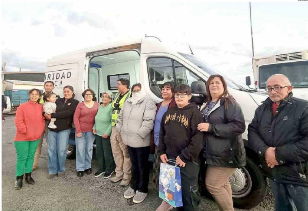
EL CUARTEL MÓVIL DE LA MUNICIPALIDAD DE CALBUCO BUSCA UN MAYOR ACERCAMIENTO CON LA COMUNIDAD EN EL SECTOR LA VEGA.

era el recorte del presupuesto que se buscaba implementar en la cartera de Seguridad, echando pie atrás el gobierno.