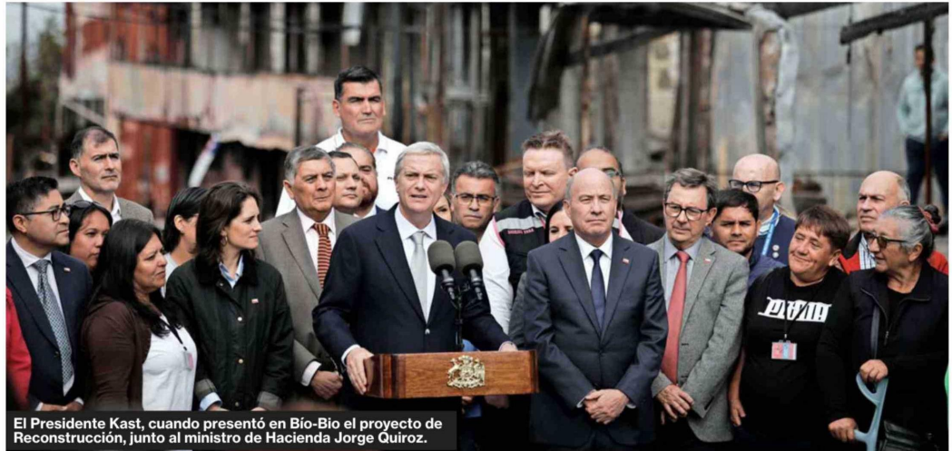
El Presidente Kast, cuando presentó en Bio-Bio el proyecto de Reconstrucción, junto al ministro de Hacienda Jorge Quiroz.

Republicanos transmitió en privado al Gobierno que el recorte en seguridad era