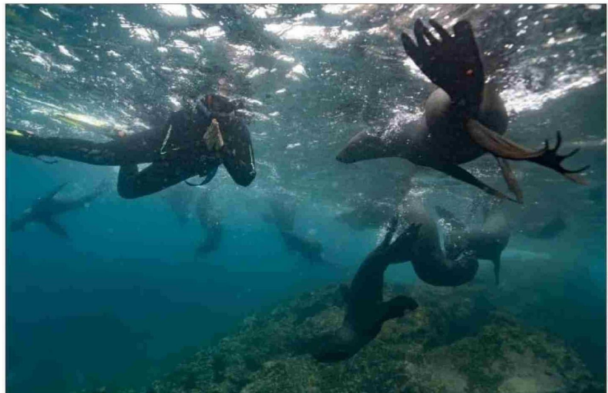
"Los parques marinos que tiene Juan Fernández, considerando a las Islas Desventuradas, son los segundos más grandes de toda América", dice el alcalde de Juan Fernández.