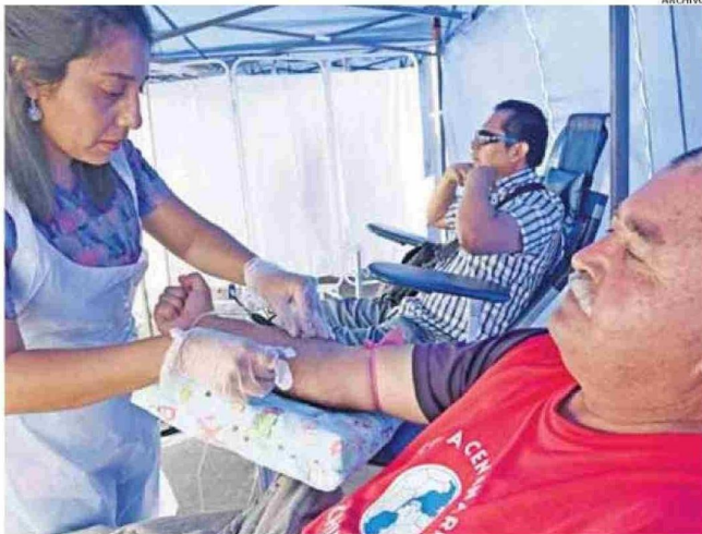
LLAMAN A LA COMUNIDAD A DONAR SANGRE DEBIDO AL BAJO STOCK QUE PRESENTA EL HOSPITAL.

Se recomienda "el cuidado con bloqueadores sobre factor 50, hay que hacerlo durante todo el año y con mayor razón acá durante el transcurso del verano, haciendo retoque al menos cada dos horas", dijo el facultativo.