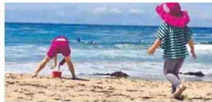
SOBRETODO A PROTEGERLOS DE LAS ALTAS TEMPERATURAS.

De lunes a jueves a contar de las 8 de la mañana, y hasta las 15 horas la Unidad de Medicina Transfusional del HCC, recibe a donantes, "y el día viernes desde 8 de la mañana a 13.30 horas. Se requiere que el donante llegue habiendo consumido desayuno, y el procedimiento dura cerca de 40 a 45 minutos o agendar cita al 552599712", informó la tecnóloga médica.