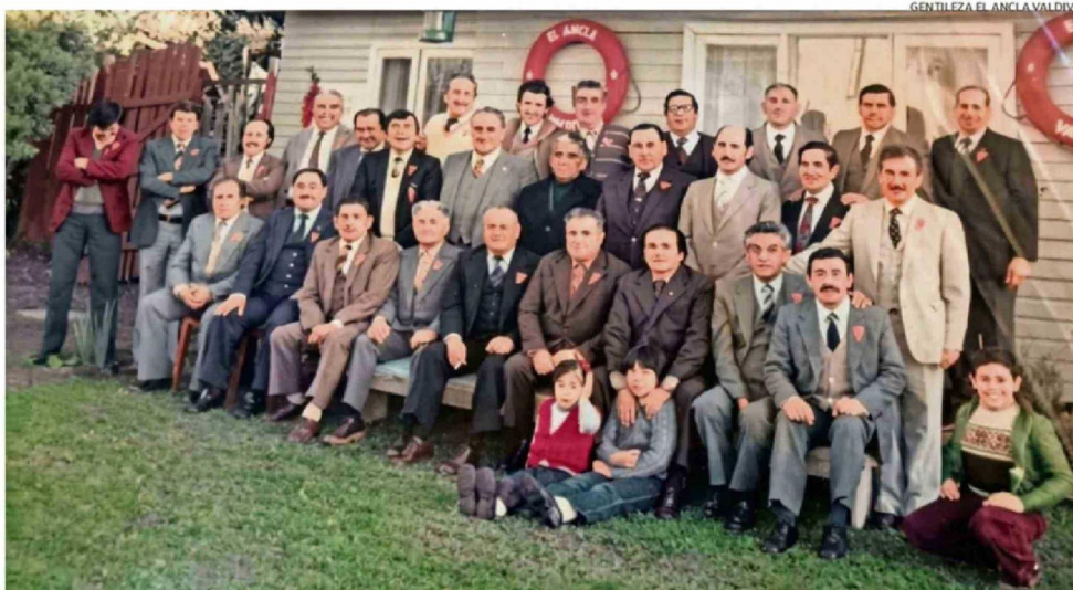
LOS FUNDADORES DEL CÍRCULO DEL PERSONAL EN RETIRO DE LA ARMADA NACIONAL "EL ANCLA" DE VALDIVIA, SE REUNIERON EL 21 DE MAYO DE 1976.

PARTICIPACIÓN. Actualmente la institución cuenta con 45 socios y hoy su directiva depositará una ofrenda floral en la ceremonia de homenaje a los héroes de Iquique.