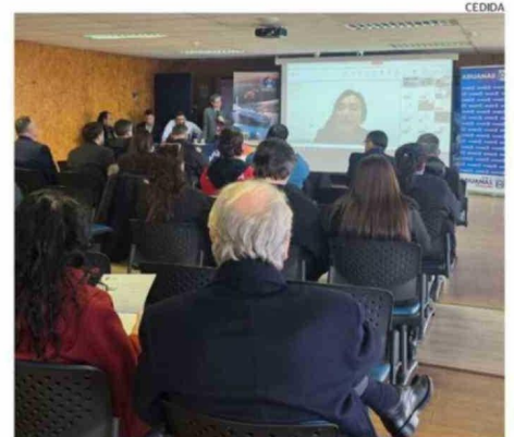
LA ACTIVIDAD REUNIÓ A FUNCIONARIOS DE LA DIRECCIÓN DE ADUANAS.