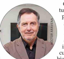
El escritor Roberto Ampuero.