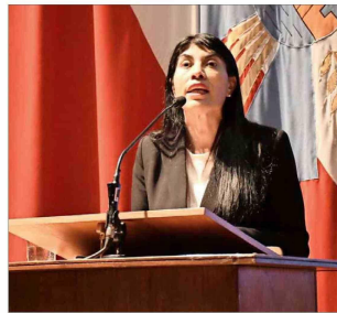
Mientras los estudiantes protestaban afuera del Aula Magna, Lincolao daba una charla sobre el rol del ministerio y el auge de la inteligencia artificial.

La presencia de Lincolao en la UACh tenía una relevancia especial, pues acompañaría el anuncio de que la Superintendencia de Educación Superior (SES) alzó el plan de recuperación del plantel, tras la compleja crisis financiera de 2024 y 2025.