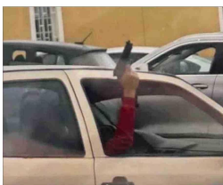
Los detenidos por este caso pasarán a control de detención hoy. En la imagen, uno de los imputados con el arma.

Este caso policial generó impacto, más aun luego del homicidio de una inspectora (59) del Colegio Instituto Obispo Silva Lezaeta en Calama (200 km al norte), perpetrado por un alumno del establecimiento (18) el 27 de marzo pasado.