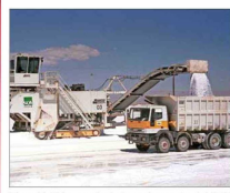
Tianqi Lithium autorizó vender parte del 22% de las acciones que posee en SQM.