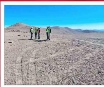
Cercano a Paranal, en Antofagasta, se iba a construir el frustrado observatorio astronómico chino.