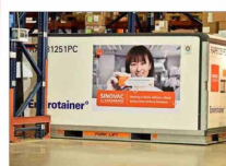
Sinovac desistió de su planta de producción local de vacunas y un centro de I+D.