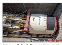
En enero, Metro de Santiago interrumpió el contrato con el consorcio TBM y Túnel SpA.

có un hito clave. El propio embajador chino exigió “la garantía efectiva de la seguridad de las personas y los proyectos chinos, la compensación por las pérdidas de la empresa y la provisión de un entorno seguro y favorable para las empresas chinas”.