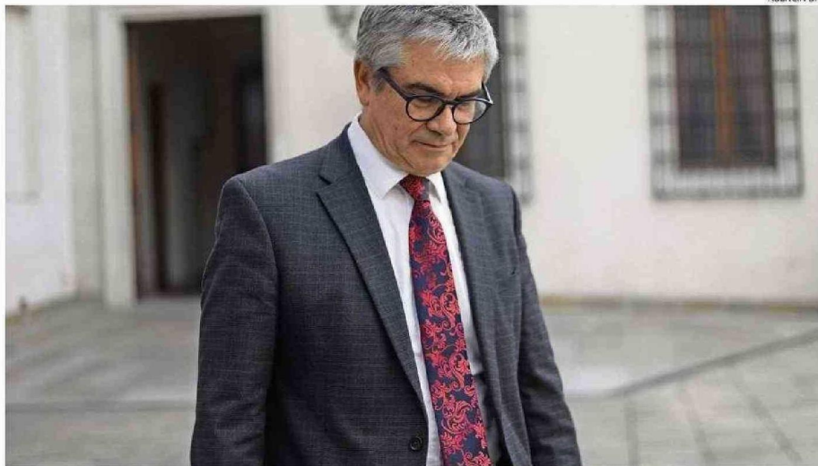
EL SECRETARIO DE ESTADO DETALLÓ QUE LAS SANCIONES PUEDEN IR DESDE EL RECHAZO DE LA LICENCIA HASTA LA DESTITUCIÓN.

"La cifra de las personas que han dejado la administración a la fecha de hoy habiendo incurrido en algunas de estas prácticas son 1.102 del go-