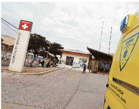
HOSPITAL DE QUILLOTA LIDERARÍA LA REDUCCIÓN A NIVEL LOCAL.