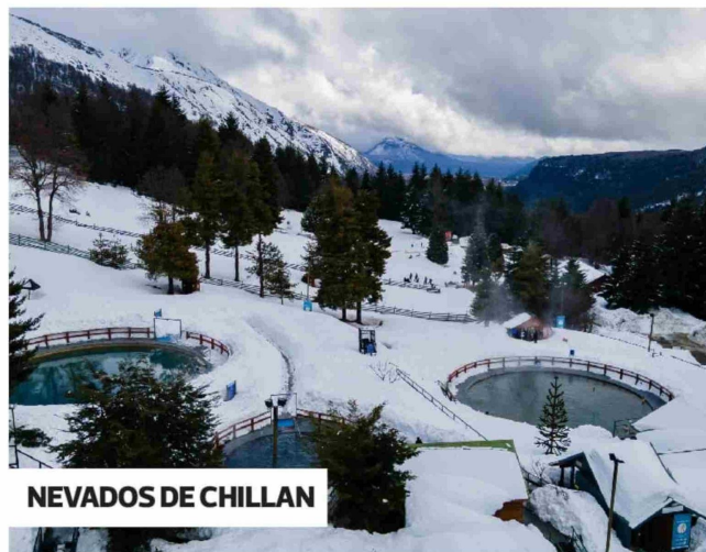
NEVADOS DE CHILLÁN

El centro espera iniciar su temporada 2025 el 21 de junio. "Tenemos muy buena ocupación a la fecha, con semanas prácticamente reservadas por completo. Vemos mucho entusiasmo de esquiadores y amantes de la montaña por esta temporada de invierno, lo que se ha traducido en la reserva y planificación de vacaciones en