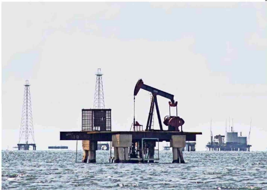
PLATAFORMA PETROLÍFERA ABANDONADA EN VENEZUELA. NO SÓLO ESTE RECURSO SERÍA EL QUE NECESITA ESTADOS UNIDOS.

Respecto de lo primero, mucha atención se ha puesto a las declaraciones del propio Presidente Trump acerca de que uno de los motivos de la acción sea el petróleo. Esta visión debe ser matizada. Es cierto que Venezuela cuenta con las mayores reservas de petróleo del planeta; pero son yacimientos con capital degradado y que requieren de inversiones que -según analistas del rubro- podrían demorar más de una década en incorporarse a la oferta mundial. Quizás más importante, y prácticamente eludido en los análisis sobre el tema, se encuentra el hecho de que Venezuela es también rico en minerales estratégicos. El país contiene depósitos de casiterita (dióxido de estaño), níquel, titanio, rodio, coltán y otros minerales raros que están emergiendo como insumos clave para industrias de alto valor y cadenas de suministro críticas a nivel global. Cuando se va al último reportaje relativo a minerales críticos elaborado