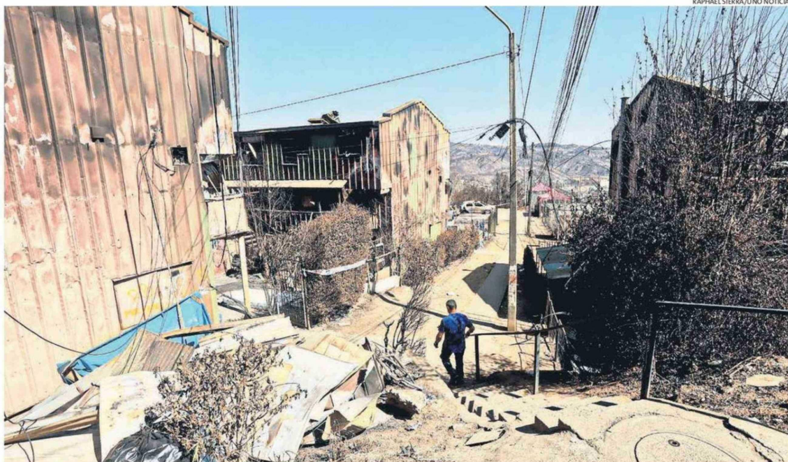
EL DOLOR DE VER DESTRUIDOS SUS ESFUERZOS DE AÑOS Y LA INCERTIDUMBRE SOBRE LO QUE VIENE HA GENERADO UN DESGASTE Sicológico EN PERSONAS MAYORES.