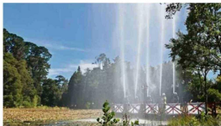
BOMBEROS ESTARÁ PRESENTE CON CORTINA DE AGUA.

La obertura del evento estuvo a cargo de la Orquesta Filarmónica de Los Ríos junto con cantantes y bailarines locales. Además, tuvo como artistas principales a la cantante Francisca Valenzuela, la banda Los Tres y el comediante Sergio Freire (ver nota en Contraportada). ☞