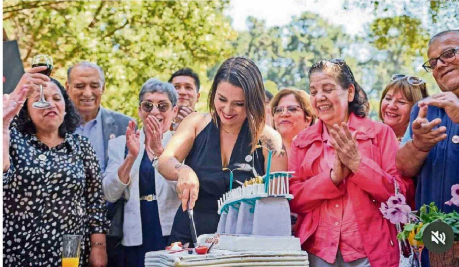
ALCALDESA DIJO QUE LA MIRADA DE LA GESTIÓN MUNICIPAL ESTÁ PUESTA EN VALDIVIA DE 2030.

los barrios que hoy se sienten abandonados por el municipio".