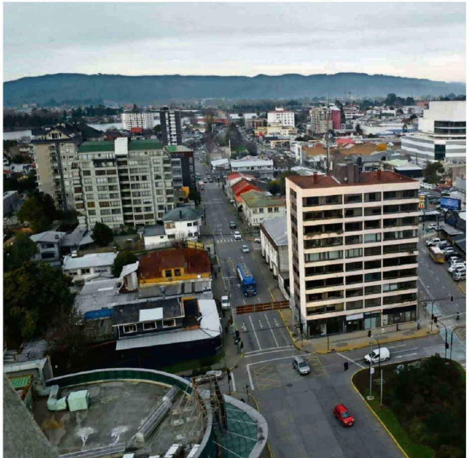
VALDIVIA CONMEMORA HOY UN NUEVO ANIVERSARIO Y CONECTIVIDAD ES UNA DE LAS PRIORIDADES.

En su opinión, "Valdivia hoy está de rodillas frente a dos crisis que la gestión actual no ha sabido, o no ha querido, enfrentar con la fuerza necesaria: la inseguridad y la parálisis vial. No podemos seguir permitiendo que nuestra costanera y el centro sean entregados al desorden y al comercio ilegal bajo una mirada permisiva. La seguridad no se recupera con retórica, sino con autoridad, tecnología y una presencia real en