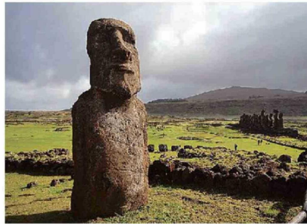
DESDE RAPA NUI RECALCARON QUE SU PATRIMONIO SUSTENTA LA ISLA.

En ese contexto, destacó que "lo que se esperaría, lo deseable, es que aquellos criterios sobre los cuales el Ministerio de Hacienda ha basado estas indicaciones, puedan ser compartidos por quienes trabajamos en los programas que están siendo citados y poder tener un debate de mucha altura de miras, y también con una proyección en lo que se busca aquí, por lo que se entiende, que es controlar el gasto".