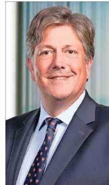
Nicolás Balmaceda, subsecretario de Obras Públicas.