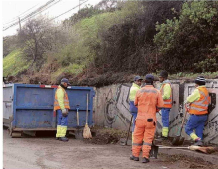
MUNICIPIOS INTENSIFICAN LABORES DE LIMPIEZA EN TERRENO.

Para Gonzalo Espinosa Doggenweiler, meteorólogo y presentador del tiempo tanto en Canal 13 como Mega, las actuales condiciones de la temperatura superficial del agua de mar hacen prever que, según modelos meteorológicos, "habrá un aumento". ¿Qué implica para nuestra región? "Este invierno con