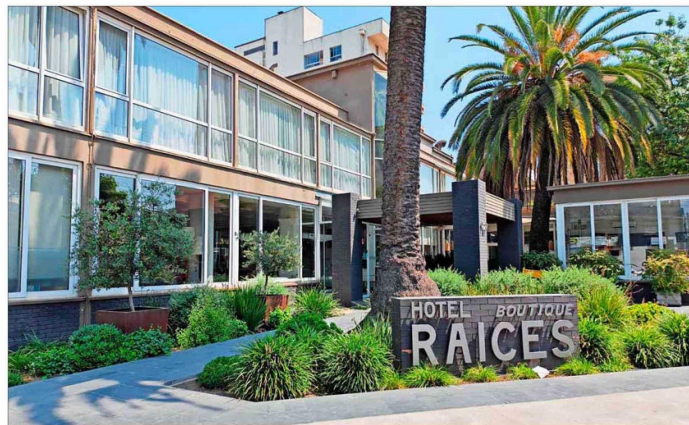
El Servicio Local de Educación Pública Los Cerezos, que incluye comunas como Curicó y Vichuquén y que está en fase de implementación, tendrá sus oficinas en el exhotel Raíces, conocido recinto de la zona.

"La paralización de profesores no es éticamente aceptable, tal como no lo es la paralización de personal médico en un hospital".