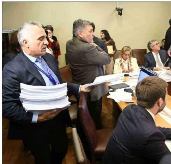
Un abogado de la Corporación, con otras dos profesionales, debió reparar los legajos de páginas con las enmiendas presentadas al proyecto.

A ratos Quiroga se llevaba sus manos a la cabeza, pero mantenía la atención a los discursos de los diputados, aunque no fueran favorables al oficialismo. El