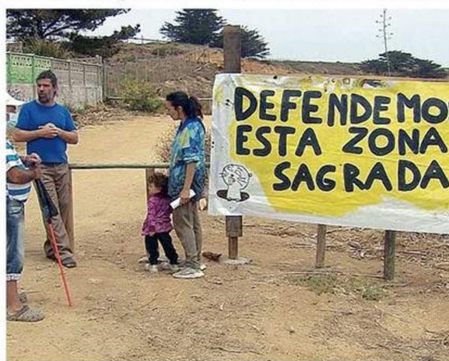
LAS OBRAS SE HARÁ EN LA PARCELA 30 DE PUNTA DE TRALCA.

dos con fecha 6 de septiembre de 2022 no son ilegales por cuanto las actividades en el terreno incluyendo el cierre perimetral del predio, estaban precedidas por sendas resoluciones exentas del Consejo de Monumentos, existiendo en ese sentido vías idóneas para reclamar contra su resultado".