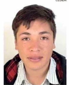
EL HAMPÓN DE 29 AÑOS ES ORIGINARIO DE PURRANQUE.