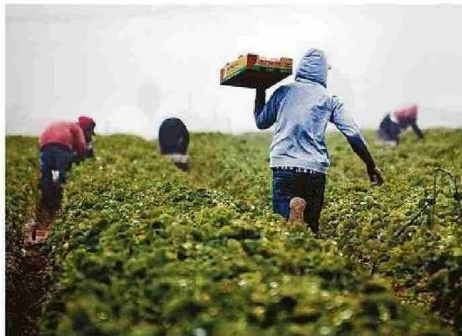
CASI 7 MIL EMPLEOS SE PERDIERON DURANTE EL ÚLTIMO AÑO.

Tiraje: 11.000 Lectoría: 33.000 Favorabilidad: No Definida