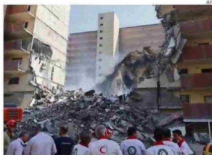
ISRAEL CALIFICÓ COMO EXITOSA LA INCURSIÓN SOBRE IRÁN.

Los bombardeos israelíes golpearon varios puntos del país persa, entre ellos la capital Teherán y una planta nuclear en Natanz, y han dejado varias víctimas fatales. Al respecto, el ministro de Relaciones Exteriores iraní, Abás Araquí defendió el