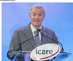
“Nuestro mensaje es muy claro: Confíen, inviertan y apuesten por Chile”, expresó el presidente electo.