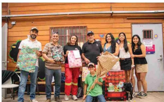
BRIGADA DE EMERGENCIA Y RESCATE MINA LLEGÓ HASTA CHACAYES PARA COMPARTIR UN DESAYUNO NAVIDEÑO

Trabajadores y trabajadoras del Área de Hidrología, perteneciente a la Gerencia de Tranques, Relaves y Recursos Hídricos (GTRH), organizaron una celebración de Navidad para los estudiantes de la Escuela Carmen Ojeda Santander, en la comuna de Las Cabras. La actividad contempló una fiesta especialmente preparada para la comunidad escolar y la entrega de regalos a niños y niñas.