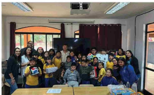
ÁREA DE HIDROLOGÍA DE EL TENIENTE CELEBRÓ LA NAVIDAD CON ESTUDIANTES DE LAS CABRAS

Con foco en la generación de valor social, estos voluntariados consolidaron la participación de más de cinco mil trabajadores y trabajadoras, tanto propios como de empresas colaboradoras de distintas gerencias, donde el involucramiento fue transversal: gerentes, supervisores, trabajadores(as), organizaciones sindicales e, incluso, familiares.