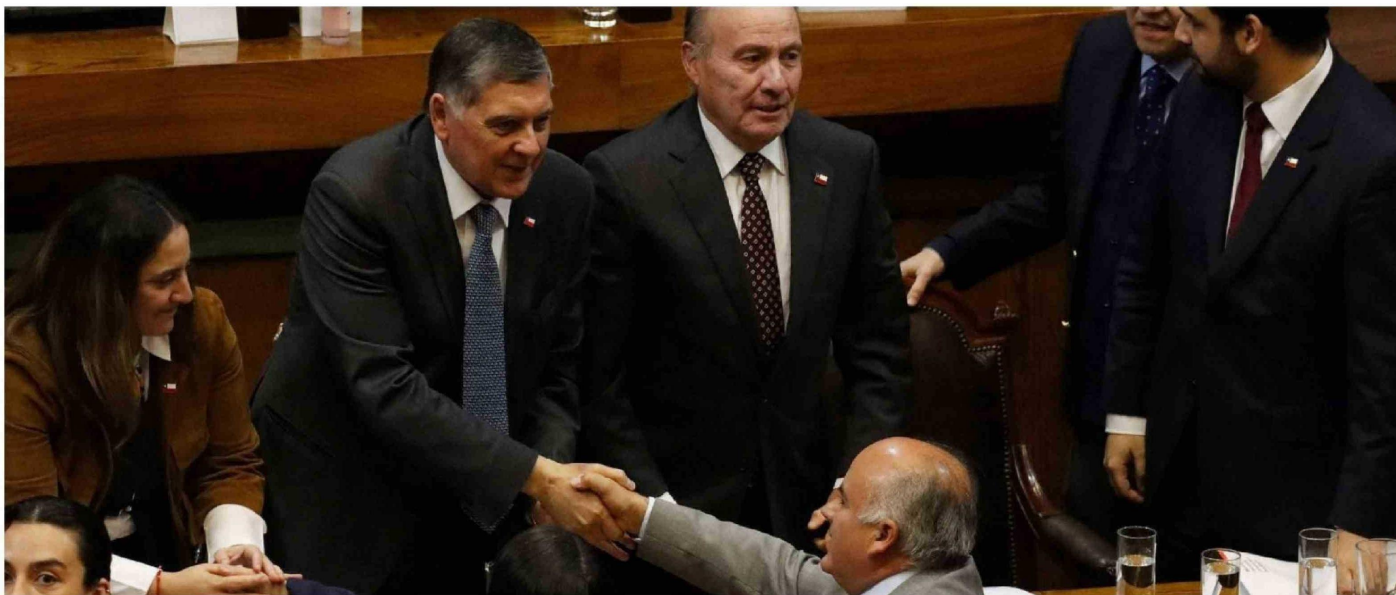
► Los ministros Claudio Alvarado (Interior y Segpres) y Jorge Quiroz (Hacienda).