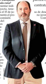
Tomás Rau, ministro del Trabajo.

Tomás Rau detalla que en las indicaciones que se presentarán en junio se partirá con una cobertura del beneficio para las mujeres que están contratadas por el Código del Trabajo.