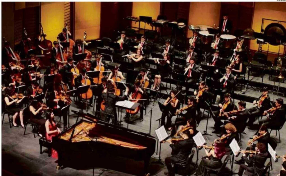
SERÁN PARTE DE ESTA INSTANCIA QUE SE DESARROLLARÁ EL 1 DE FEBRERO EN EL ESPACIO TRONADOR, SALA NESTLÉ, DEL TEATRO DEL LAGO.

Los usuarios del Centro de Salud "Kümelen" de Osorno, junto a sus cuidadores, serán los invitados especiales del concierto "FOJI 25 años, Imágenes Sinfónicas", dirigido por Paolo Bortolameolli, que contempla la interpretación de obras de Wagner, Chopin,