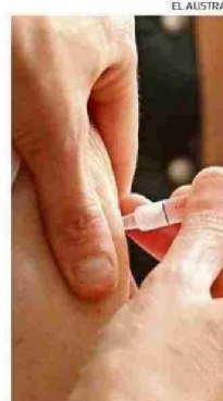
LA VACUNA ES GRATUITA PARA LA POBLACIÓN OBJETIVO.