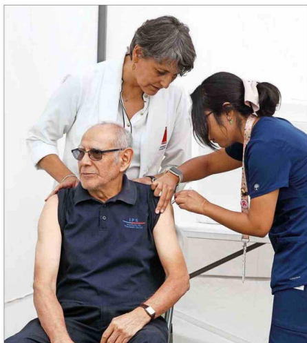
POBLACIÓN EN RIESGO. — La vacunación contra la influenza durante este año alcanzó solo al 64,9% de las personas de 60 años y más.

Si en 2023 hubo 79,6 mil consultas por esta enfermedad, durante este año la cifra se incrementó a 120,6 mil, es decir, 51,4%. Los especialistas llaman a reforzar la inmunización, en especial entre los adultos mayores.