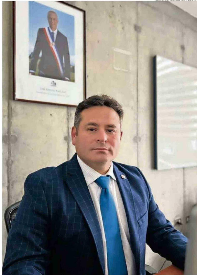
ALVARADO ES INGENIERO NAVAL CON MENCIÓN EN TRANSPORTE MARÍTIMO DE LA UNIVERSIDAD AUSTRAL.

En 2010 ingresó como agente a una empresa dedicada a administrar barcazas en convenio con el Minis-