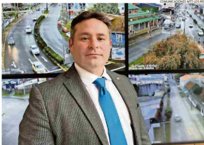
TAMBIÉN COMPLETÓ LA CARRERA DE INGENIERÍA CIVIL INDUSTRIAL EN LA UNIVERSIDAD SAN SEBASTIÁN.

Otro de los desafíos es la conectividad, buscaremos otorgar un mejor servicio a las personas en todas nuestras licitaciones de conectividad en zonas aisladas. Nosotros no solamente tenemos conectividad terrestre, sino que también marítima, lacustre y fluvial. La