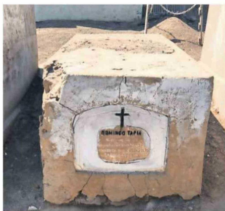
ASÍ SE ENCONTRABA LA TUMBA ANTES DE LA INTERVENCIÓN.