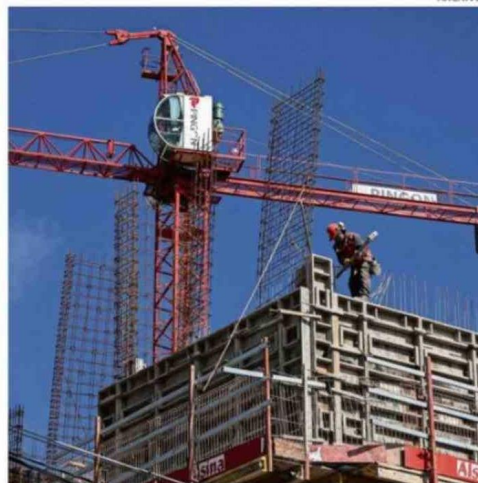
LA REGIÓN DE LOS LAGOS ALCANZÓ UNA TASA DE DESOCUPACIÓN DEL 6,8%.