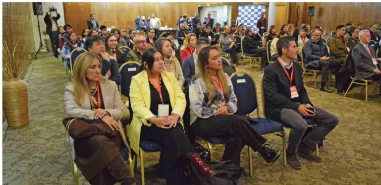
LA INICIATIVA IMPULSADA por Diario La Tribuna desde 2021 reunió en Los Ángeles a representantes de distintos sectores para debatir sobre desarrollo territorial y sostenibilidad.

demandaban que el proyecto no fuera "a puertas cerradas" y que dejara un valor real en el territorio. Estollejó a un rediseño radical de la operación: se redujo la variación de la cota del embalse de los 10 metros originalmente proyectados a solo 1 metro. Este cambio técnico permitió que la central fuera compatible con el desarrollo turístico, manteniendo un nivel de agua estable para actividades recreativas.